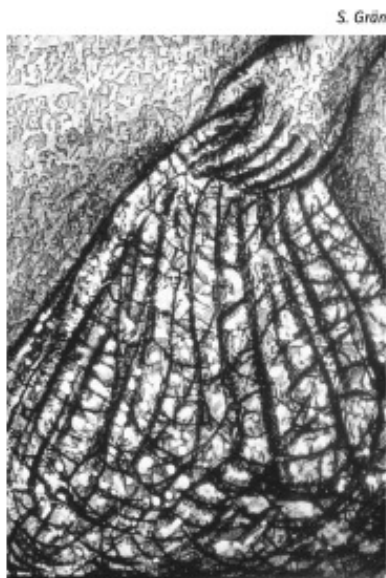
Menschen fischen – das geht nur mit der Botschaft des Evangeliums, deren Symbol das Netz ist, nicht die Angel. Menschen fischen für Gott können nur die, die selbst von diesem Netz wie gefangen wurden, gefangen für die Freiheit der Kinder Gottes.

ist erfüllt, das Reich Gottes ist nahe. Kehrt um, und glaubt an das Evangelium. (Aus dem Evangelium nach Markus 1,14-20)