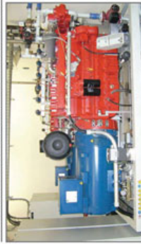
STANDORT DER BLOCKHEIZKRAFTWERKE DER GEMEINDE IN DER HALLE SCHICK UND SAILER

KRAFT-WÄRME-KOPPLUNG = STROMERZEUGUNG + WÄRMENETZ