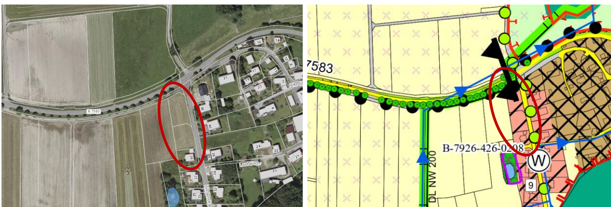
Abbildung 1: Luftbild und Ausschnitt aus dem rechtsgültigen Flächennutzungsplan

Das Plangebiet umfasst die Grundstücke mit den Flurstücks-Nummern 454 und 454/5 mit einer Fläche von ca. 0,25 ha und wird bislang als Wiesenfläche genutzt. Der westlich angrenzende Bereich wird ebenfalls landwirtschaftlich genutzt. Im Süden und Osten grenzt die Wohnbebauung der „Lindenstraße“ an. Im Norden befindet sich ein Radweg sowie die durch eine Baumreihe abgesetzte Kreisstraße K7583 (Biberacher Straße).